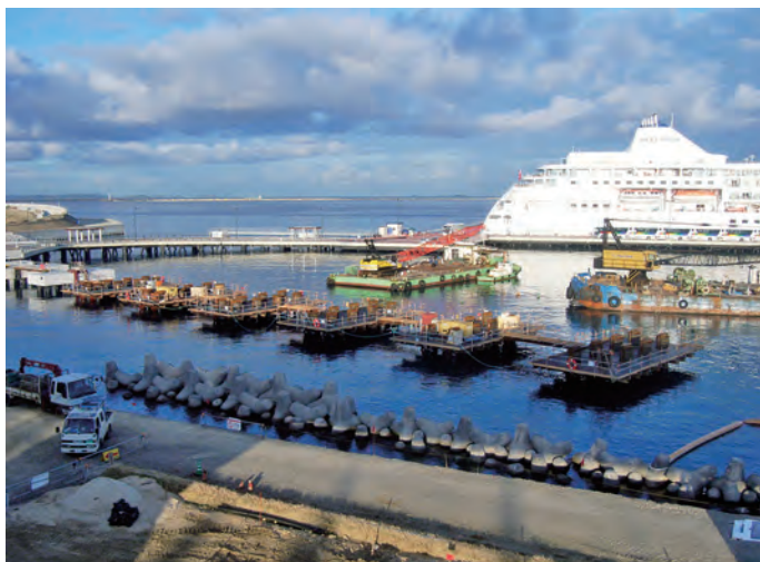
建設現場の様子(2010年11月)

現在は単身赴任生活。家族のいる新潟に月1回程度帰るのが楽しみという。若いころは温暖な気候と気さくな人柄に惹かれ、自ら手を挙げて沖縄勤務を希望したが、「今は家族のいる地元(新潟)から通える現場がいいね」と笑う。