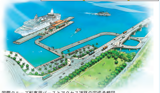
国際クルーズ船専用バースとアクセス道路の完成予想図